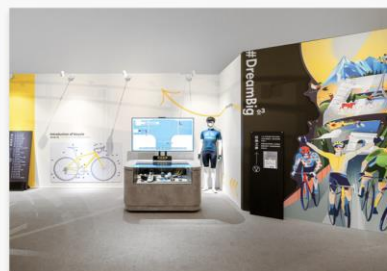
全年齡學習場域 新手村、安全教育、冠軍榮耀