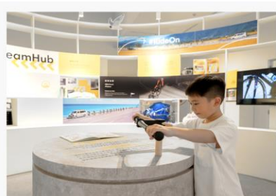
孕育之巢Dream Hub 自行車教育、旅遊及未來設計