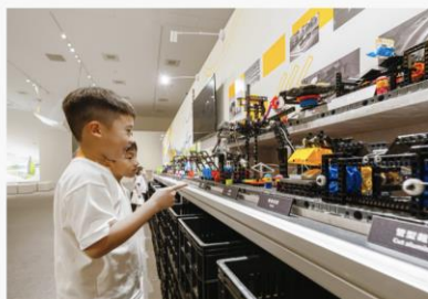
STEAM展示教育 智高積木打造自行車生產線